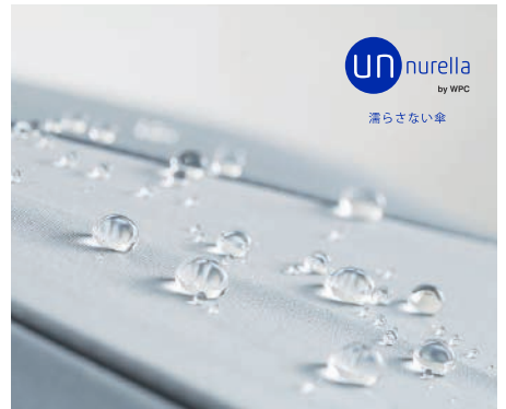
Women's/ Men's UMBRELLA