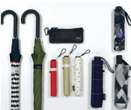
UNISEX UMBRELLA / PARASOL