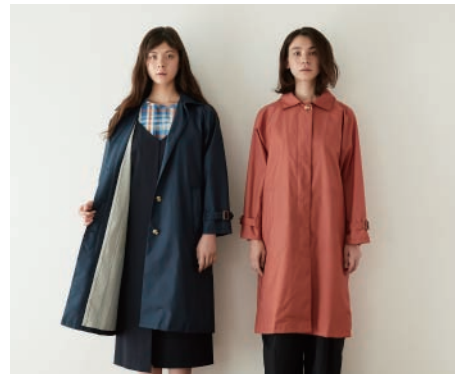
Women's RAIN WEAR