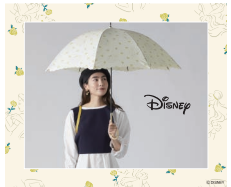
Disney collection UMBRELLA / PARASOL