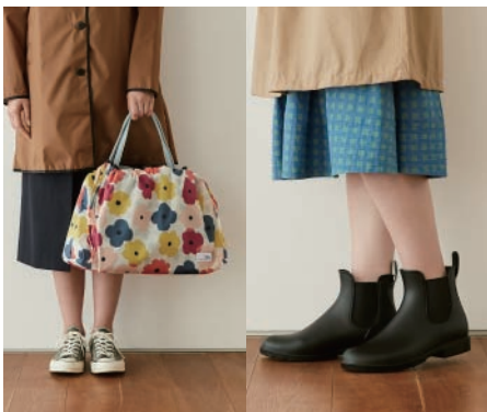
Women's RAIN GOODS